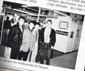
Discom avec les meilleurs DJs de France